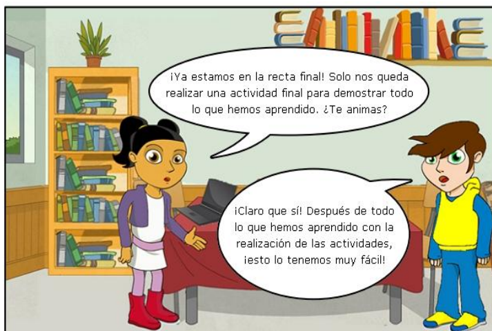
Ilustración. Actividad final.