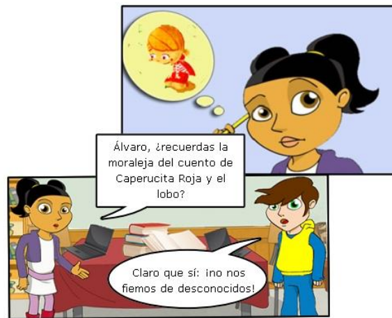
Ilustración. Moraleja del cuento de Caperucita roja.