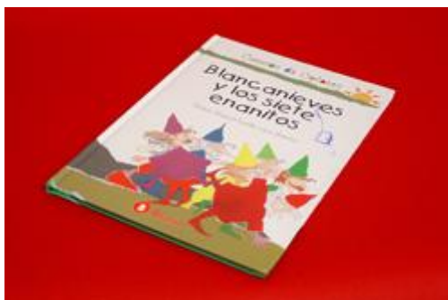
Fotografía. Los cuentos.

En esta secuencia didáctica se introducirá el género de los cuentos. A través de las actividades propuestas se conocerá las características de un cuento, así como la estructura que debe seguir. Gracias a Internet y a sus herramientas se avanzará y alcanzará el objetivo previsto.