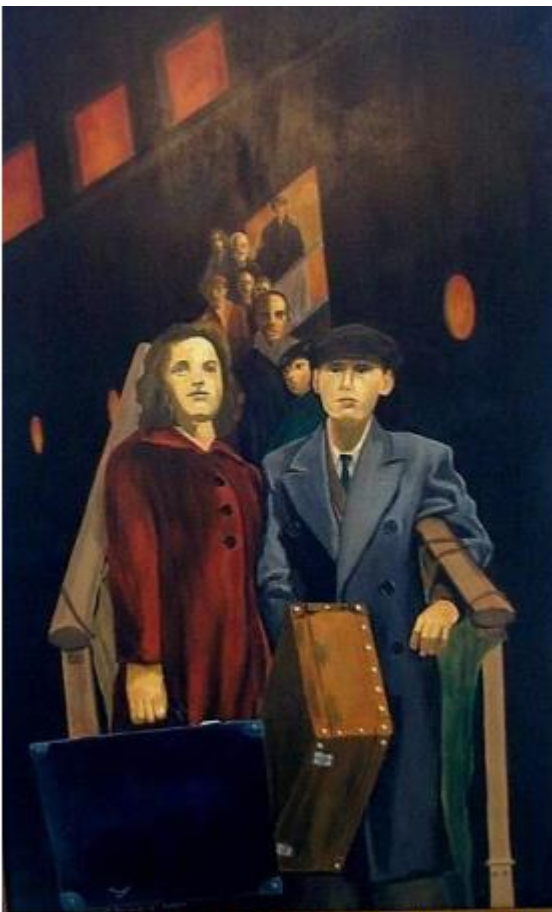
Imagen: "Political refugees" de Reginald Gray en Wikimedia Commons (PD)