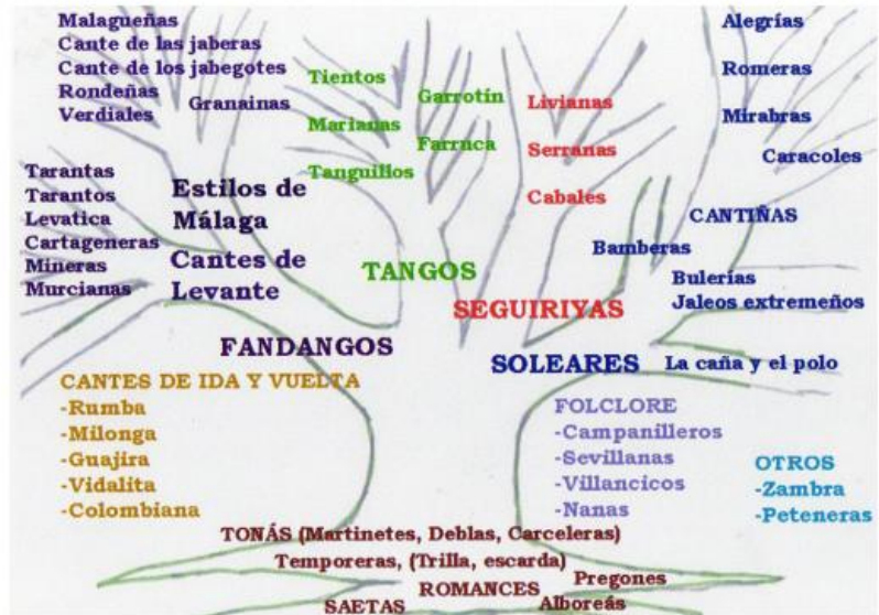
Imagen 1. Esquema del árbol genealógico del canto flamenco por José Blas Vega.

Investiga sobre ellas y en qué conectan las “Sevillanas” con el “Flamenco”.