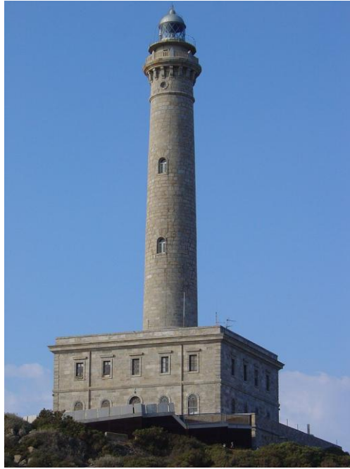
Faro del Cabo de Palos.