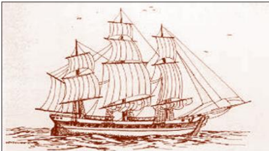
Ilustración de una goleta de la primera mitad del siglo XIX.