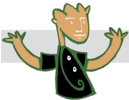
Imagen alojada en wikimedia commons con licencia CC.