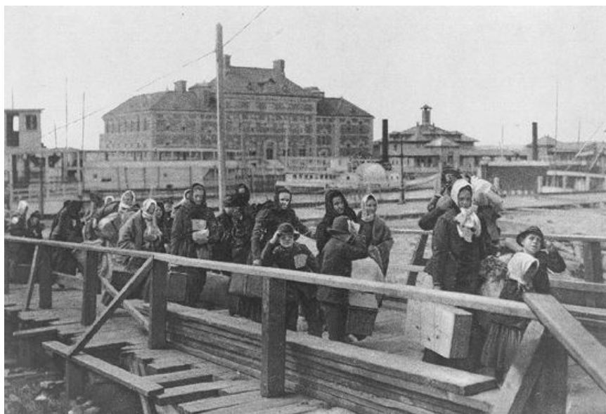
Migrantes desembarcando en la isla de Ellis (Nueva York) a inicios del siglo XX.

a) Como has comprobado, el viaje que hacían estos migrantes era largo, complejo y pesado. Pero una vez llegado a su destino, aún les quedaban dificultades. Explica cómo era el proceso de llegada, los controles que sufrían los inmigrantes, cómo se les seleccionaba. Si puedes completar tu explicación con imágenes de la época, mucho mejor.