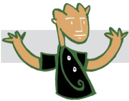
Imagen alojada en wikimedia commons con licencia CC.