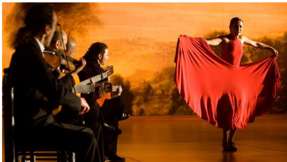
La bailaora Sara Baras, en la presentación del rodaje de la película 'Flamenco,Flamenco', del director Carlos Saura.

La Unesco ha declarado esta tarde el flamenco Patrimonio Cultural Inmaterial de la Humanidad. La Organización de las Naciones Unidas para la Educación, la Ciencia y la Cultura ha dado el sí esta vez al arte jondo y lo ha incluido en la lista de manifestaciones culturales que forman parte del Patrimonio Cultural Inmaterial de la Humanidad. La UNESCO rechazó en 2005 que el flamenco obtuviera esta denominación. También han sido reconocidos los castells y los cantos de la Sibila mallorquines.