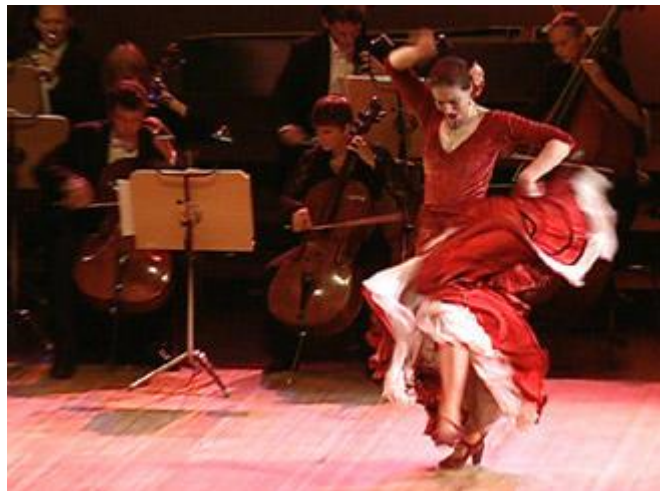
"Bailaora" de flamenco en un escenario español.

El flamenco dio hoy el salto más allá de las fronteras de Andalucía y España y ya es Patrimonio Cultural Inmaterial de la Humanidad. Así lo anunció el comité de la UNESCO reunido en Nairobi.