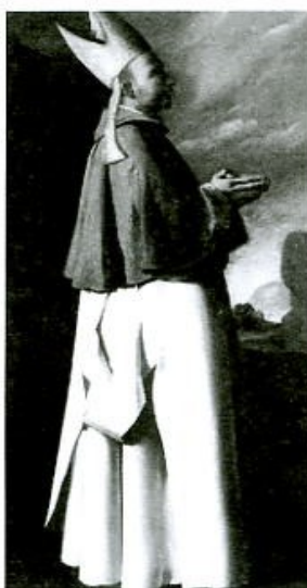
San Hugo de Grenoble

Este conjunto de nueve pinturas que originalmente fueron diez, estaba situado en torno al sagrario de la Cartuja, localizado tras el altar mayor, como es usual en estos monasterios. En un lugar tan especial y reservado, los cartujos quisieron representar a los principales santos de su orden, que junto a dos ángeles turiferarios (portadores de incensarios) formaban un cortejo de honor al Santísimo.