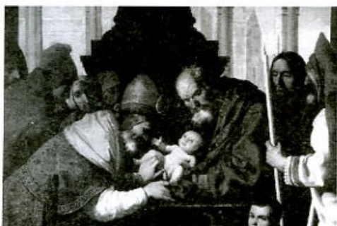
Detalle de La Circuncisión. Grenoble, Musée de Peinture et de Sculpture.