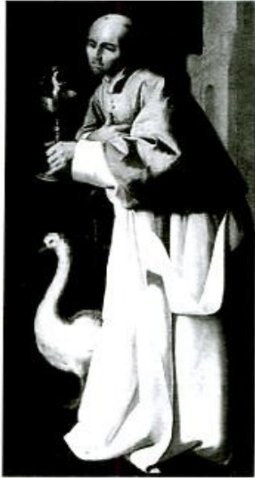
San Hugo de Lincoln