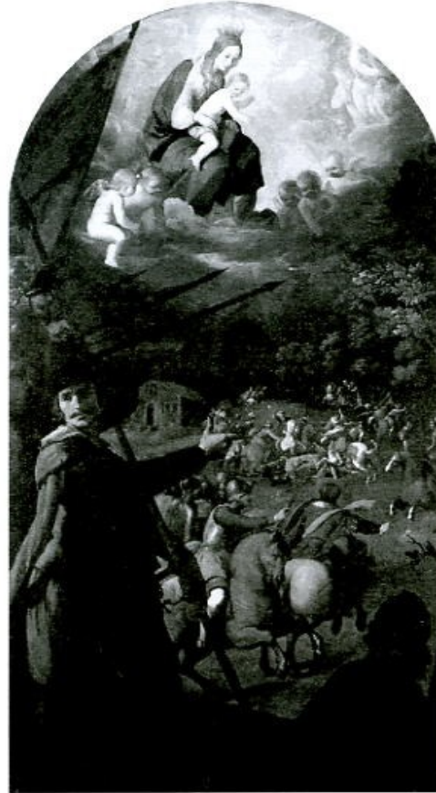
La Batalla de Jerez. Nueva York, Metropolitan Museum of Art.

Actualmente Andalucía cuenta con la ley LEY DEL PATRIMONIO HISTORICO DE