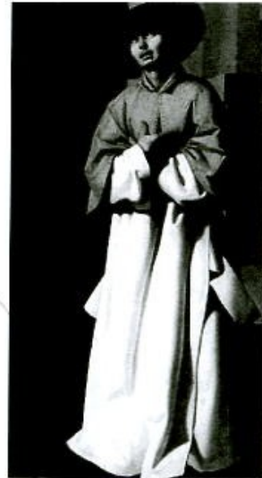
Beato Nicolás Albergati