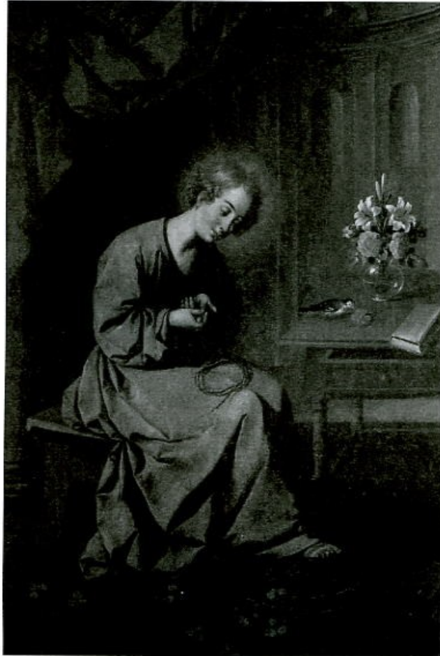
Niño Jesús de la Espina. Museo de Bellas Artes, Sevilla.

El arte Español vivió un período de gran esplendor, que alcanzó especial significación en la pintura durante el siglo XVII, como consecuencia del predominio político desempeñado por España en Europa a partir del descubrimiento de América. Sevilla, centro de la actividad comercial con el Nuevo Mundo, fue uno de los focos artísticos más importantes. En ella nacieron o se formaron algunos de los principales pintores de esa época.