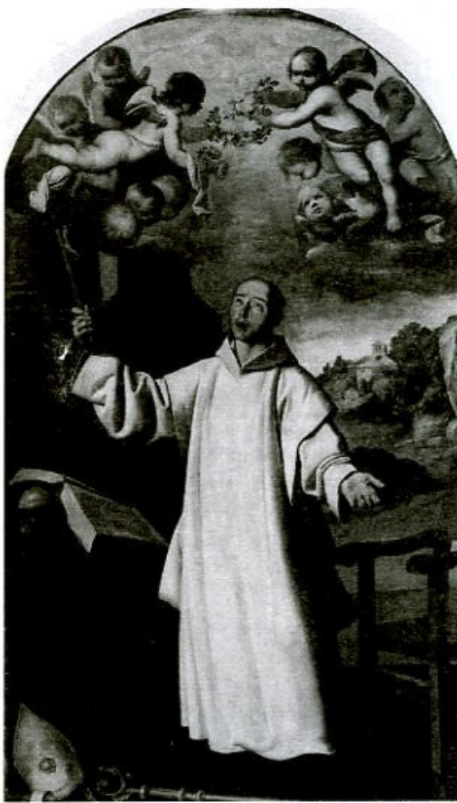
Apoteosis de San Bruno. Obra restaurada en el Departamento de restauración del Museo de Cádiz, en colaboración con la obra socio cultural Cajamar.

Los pintores y escultores utilizaban elementos significativos relacionados con la vida de los personajes que representaban para que fueran reconocidos fácilmente por el público que los contemplaba. A continuación tienes descritos los elementos utilizados por Zurbarán para representar el éxtasis que vivió San Bruno mientras se dedicaba a la contemplación y meditación. Trata de localizarlos en la reproducción del cuadro que tienes en esta página y prolonga la flecha hasta el lugar que le corresponde en ella: