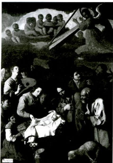
Adoración de los pastores. Grenoble, Musée de Peinture et de Sculpture.