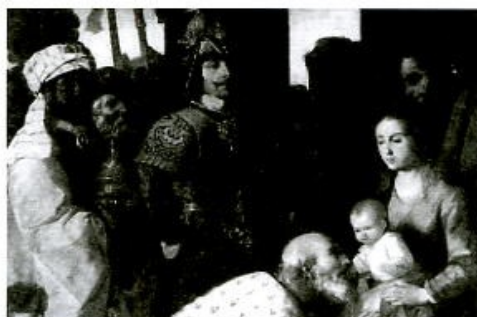
Detalle de La adoración de los Magos. Grenoble, Musée de Peinture et de Sculpture.