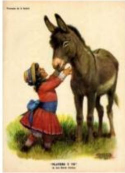
Juan Ramón Jiménez, Platero y yo

Es tierno y mimoso igual que un niño, que una niña...; pero fuerte y seco por dentro, como de piedra”.