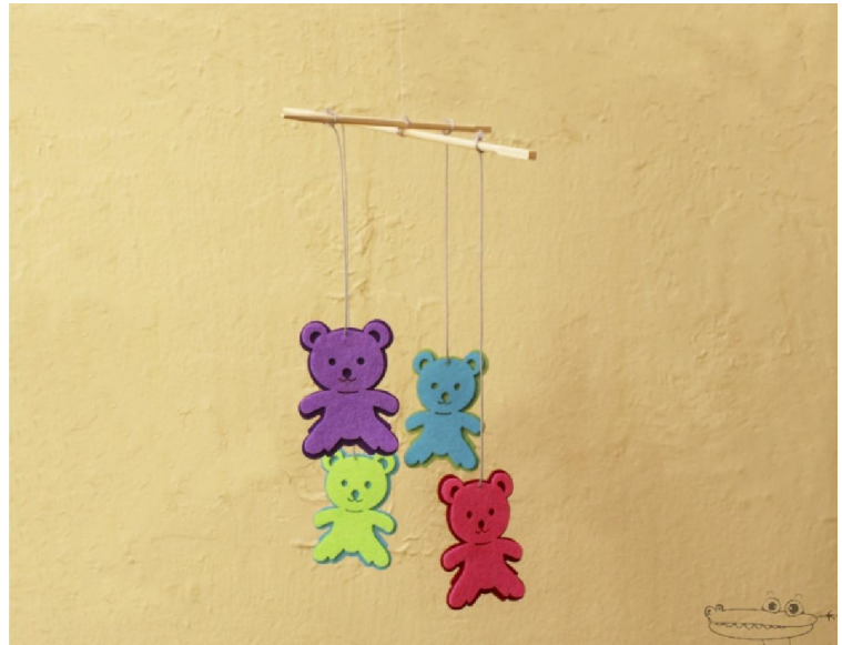
MONTAJE DE UN MÓVIL PAPIROFLEXIA