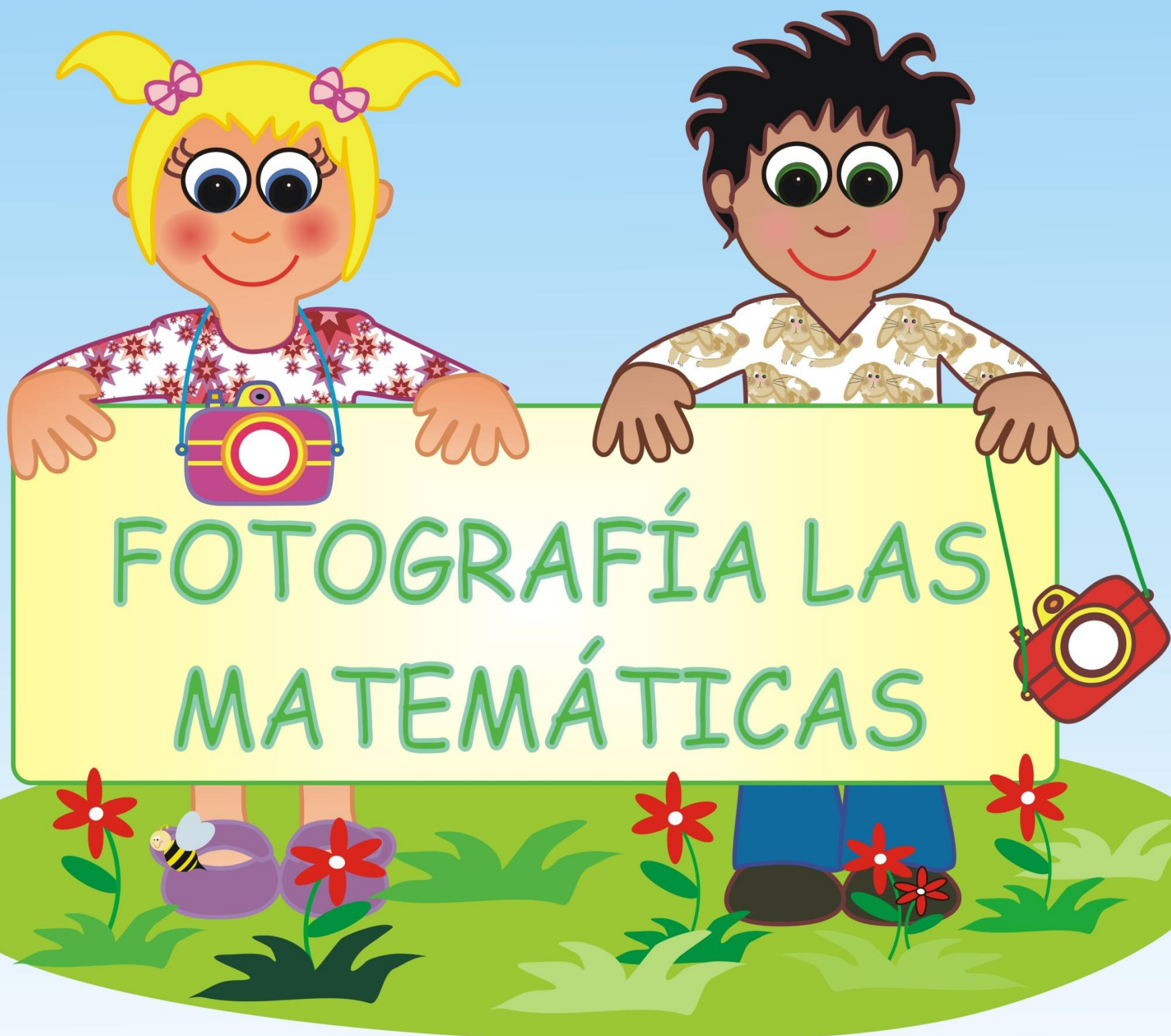
Ilustración: María del Mar Quirell José.