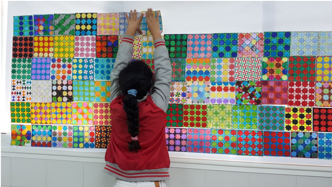
Alumna componiendo el mural de azulejos.