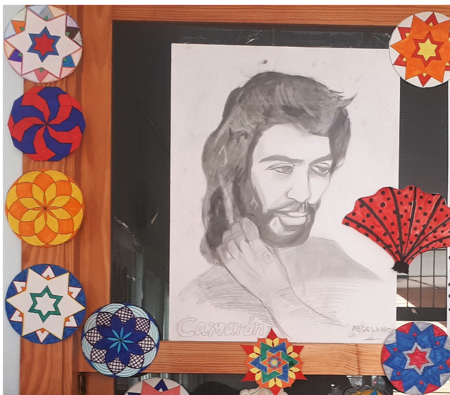
"Camarón de la Isla" Lápiz sobre papel.

Cantaor flamenco, icono del cante jondo y la cultura gitana.