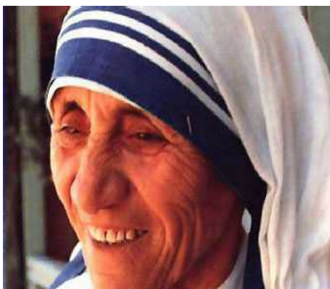
MADRE TERESA DE CLACUTA

http://construyamoslapaz.wordpress.com/personajes-que-han-luchado-por-la-paz/