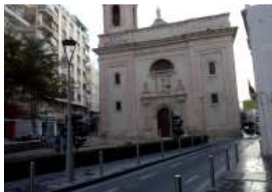
Plaza en la actualidad.

En la iglesia de San Sebastián se refugia en una oración íntima en sus momentos difíciles.