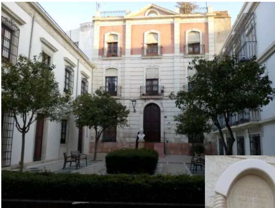
Casa donde vivió Federico García Lorca en la actualidad. Placa en la fachada.