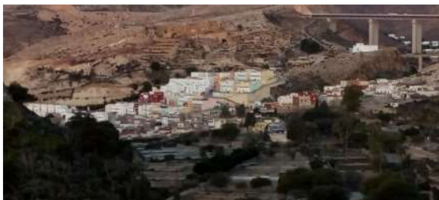
Barrio de la Chanca en la actualidad.