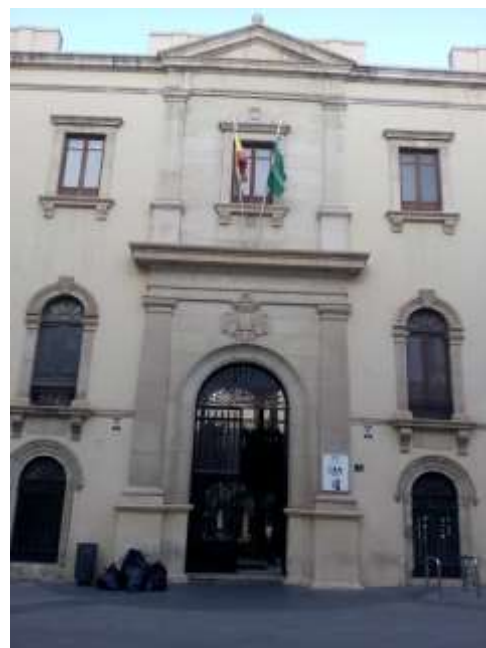
A la izquierda, vista de la fachada Escuela de Arte en la actualidad. A la derecha, puerta principal.