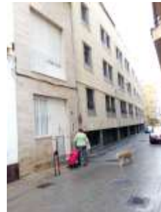
Foto de la izquierda: Edificio donde se encontraba el Hotel la Rosa.

Foto del centro: Bajo el logo de la Caixa se aprecia los restos del nombre del Hotel Andalucía.