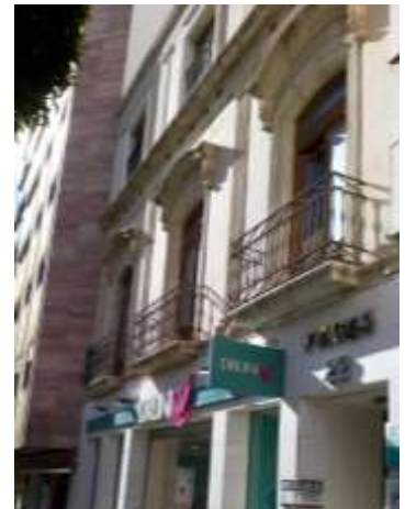
Estado actual de la Antigua Biblioteca Villaespesa, 2018. Paseo de Almería, 22

Tras hacer la presentación "La señorita Celia Viñas" fue muy aplaudida. Carmen Conde inicia su disertación agradeciendo las frase (sic) laudatorias con que ha sido presentada, que califica de maravillosas, por proceder de quien es una de las mujeres más notables, por su labor, en España. Hace un bello símil sobre Almería como un barco, y describe su paisaje blanco y azul .... 24