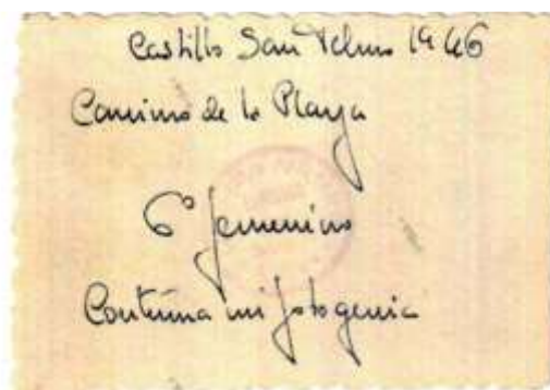
4 de abril de 2016