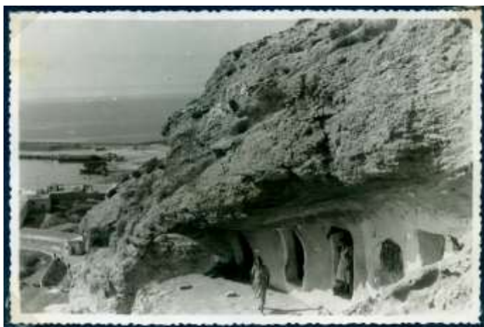
Detalle de las Cuevas del Puerto / Falange Española Tradicionalista de la J.O.N.S. Jefatura Provincial de Almería. 1943.

--- "Casas pintadas de azul, sangre, calamocho." 90