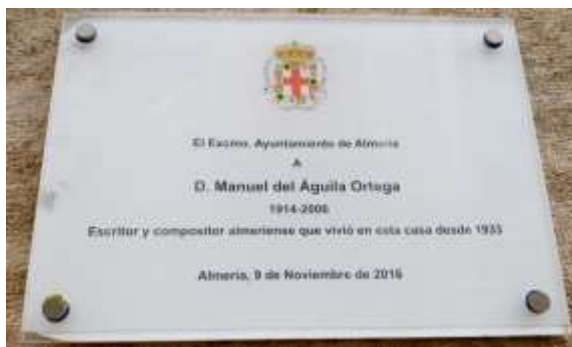
Placa en la fachada de la casa donde vivió D. Manuel del Águila

Quien quiere saber del cielo véngase acá sin recelo y trague bien el anzuelo de Almería.