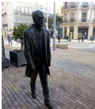
Estatua de Nicolás Salmerón, símbolo de liberalismo en Almería. Nació en Alhama.