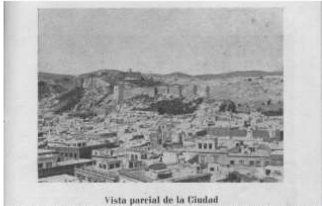
Vista parcial de la Ciudad