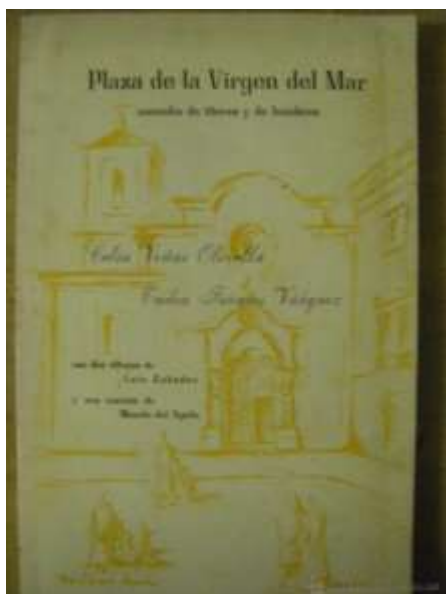
Portada libro "Plaza de la Virgen del Mar"