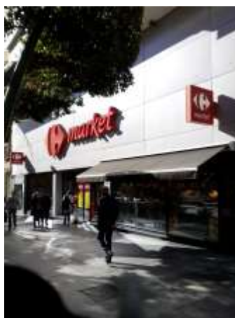
Edificio actual donde se encontraba el Hotel Simón.

Deja pronto el Hotel Simón, donde se instaló el mismo día de su llegada a Almería (8 de marzo de 1943) "... porque me dí cuenta enseguida de dos cosas: que era muy triste y sería muy caro". 27