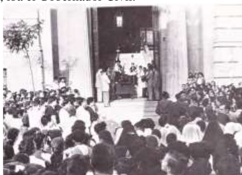
Celia en el Instituto llevada a hombros al cementerio por los alumnos, y en el Instituto antes de ser llevada al cementerio.