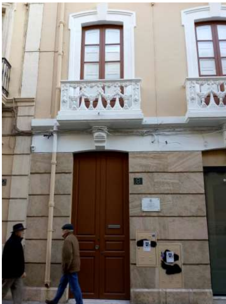
Placa en la fachada de la casa donde vivió D. Manuel del Águila.

Salpicando de espuma, esbelto Hermes intacto, te sobraba la clámide" 7