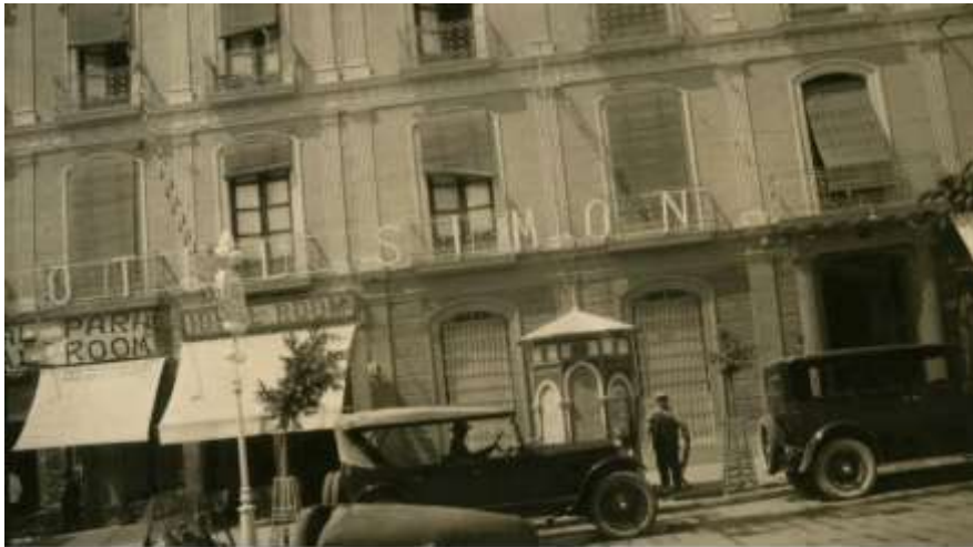
HOTEL-SIMÓN- Fuente: Ideal_Almería-edición-digital-3 septiembre 2016 Estuvo en este lugar desde 1900 a 1965. Hoy (2019) en un edificio nuevo está Carrefour-Market Fue la primera residencia en Almería de Celia Viñas, cuando llegó el 8 de marzo de 1943 Estuvo muy pocos días porque lo encontraba triste y caro.