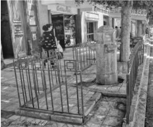
El cañiyo en su antigua ubicación desde la Puerta Purchena a la Rambla Obispo Orberá. Tomado de fb: Juan Luís del Olmo Tejero. Almería en Blanco y Negro. 13.feb-2013

“La Puerta de Purchena donde hay un “cañiyo” de agua con raras propiedades casamenteras. Si una bebe de él... ya no sale de Almería...” 13