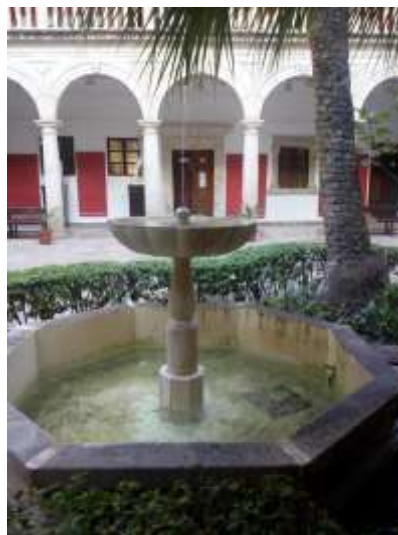
Fuente interior Escuela de Arte en la actualidad.