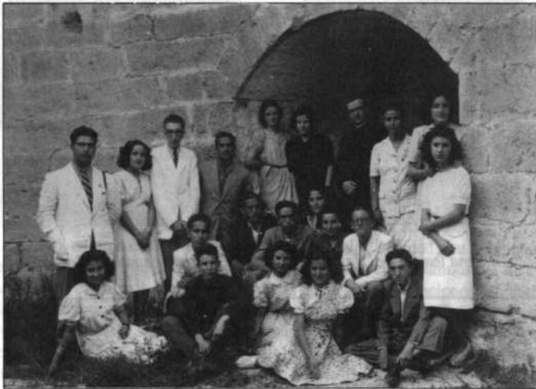
En la Alcazaba. Almería, 7 julio, 1944. Paseos, excursiones....con recitación de poemas, comentarios literarios...

“Un paseo, como los que ella acostumbraba a dar con sus alumnos de forma casi revolucionaria, a La Garrofa, a la Alcazaba, al Alquíán o al Faro del Puerto.” 95