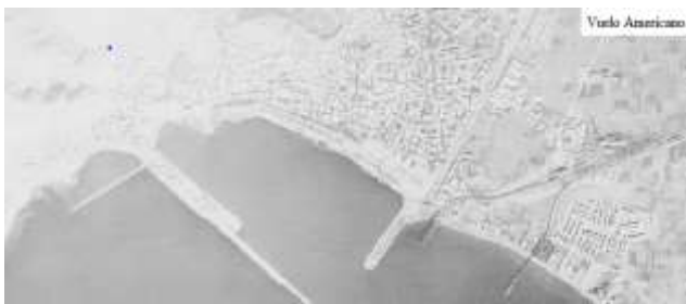
Vuelo americano en 1945. Se ve que aún no está construido pescadores.

Era uno de nuestros sitios preferidos, por su estar en calma, sin olas, y porque había anchura para jugar a la pelota.” 92