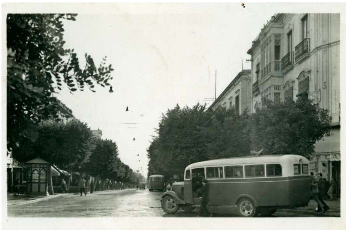
Paseo del Generalísimo. 1950. Tomada de : Biblioteca Digital de la Diputación Provincial de Almería. Visto febrero 2018