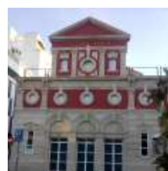
Teatro Apolo en la actualidad.

Teatro Apolo entre los años 1940-1960.