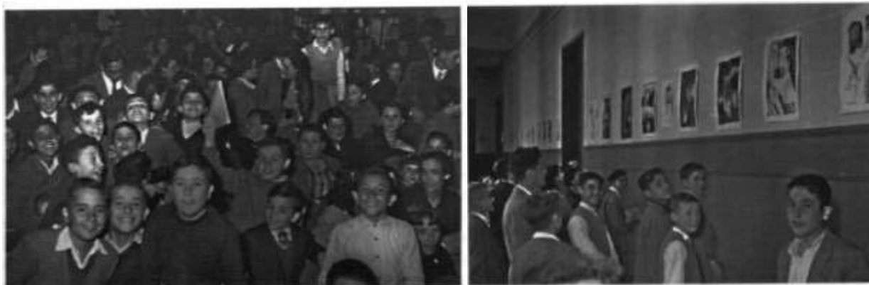
A la izquierda niños del Instituto y madres el 7 de diciembre de 1954 cuando se organizaba en el centro la gran velada con motivo del día de la madre. A la derecha, alumnos viendo la exposición de carteles que todas las primaveras se hacía por Semana Santa. Año 1953.