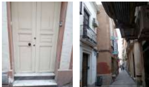
Casa Conchita Rabell en la actualidad.

"Conchita Rabell nos armó un jaleo con el Rectorado..." "El asunto es desagradable por la actitud de Conchita Rabell y más para mí que siempre la he defendido y ahora no la encuentro defendible. Me callo y procuro calmar los ánimos" 80