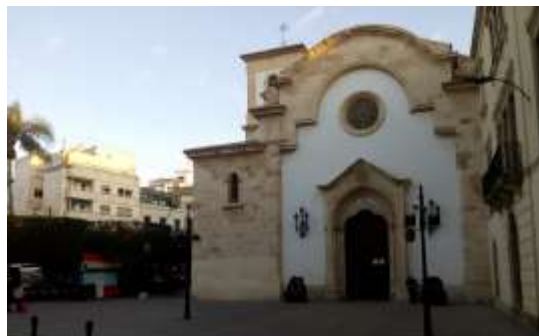
Plaza Virgen del Mar en la actualidad.

“Sor María, Sor María, en vuestras manos de plata con sortija de alegría. Cincuenta anillos de oro cuentan los años, tesoro de esponsales y ternura. Y el Señor se me figura, si tu labor te desvela, un maestro de hermosura en el cielo de tu escuela.” 72