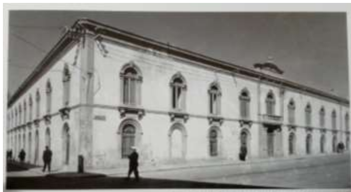
Edificio en 1960, más o menos como sería en la época de Celia Viñas.

Sólo una brizna de yerba podría doblegar vuestro cuerpo, enternecer vuestra mirada. No se si vais a maldecirme o a regalarme una muñeca con ojos de cristal. Os hago invulnerables pero jamás os dí un escudo para el celeste Sagitario de la verdad.