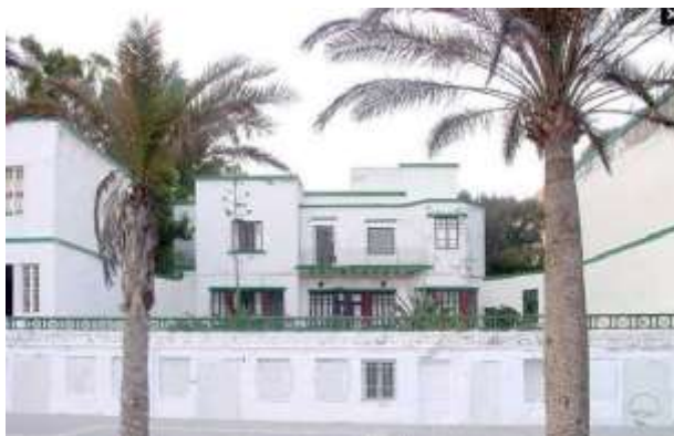
Villa Pepita. Como estaba antes de ser derribada en la zona de Villagarcía.

4 de abril de 2016