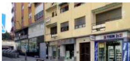
Ubicación del antiguo Gobierno Civil en la actualidad.

"Como veis, también nos hemos conquistado al nuevo Gobernador" 44 Mayo 1946