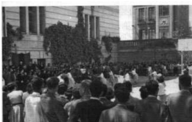
A la izquierda Instituto en la actual y detalle de la escalera del interior. A la derecha, exhibición deportiva en el patio del Instituto de la calle Javier Sanz con el Obispo presidiendo el acto. Abril de 1953.

Fuente: Eduardo del Pino Vicente. Almería de ayer y siempre. Edita. La Voz de Almería. 2014