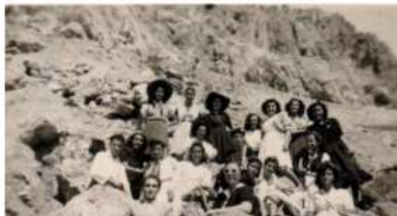
De excursión con sus alumnas de sexto femenino, en 1946. En el dorso de la foto su caligrafía.