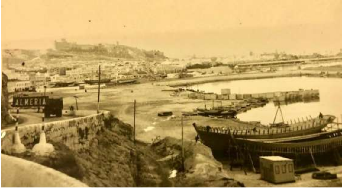
Playa Arenica Blanca a la entrada de Almería en los años 50. Hoy Puerto Pesquero. Localización por Pepe el Barbero.