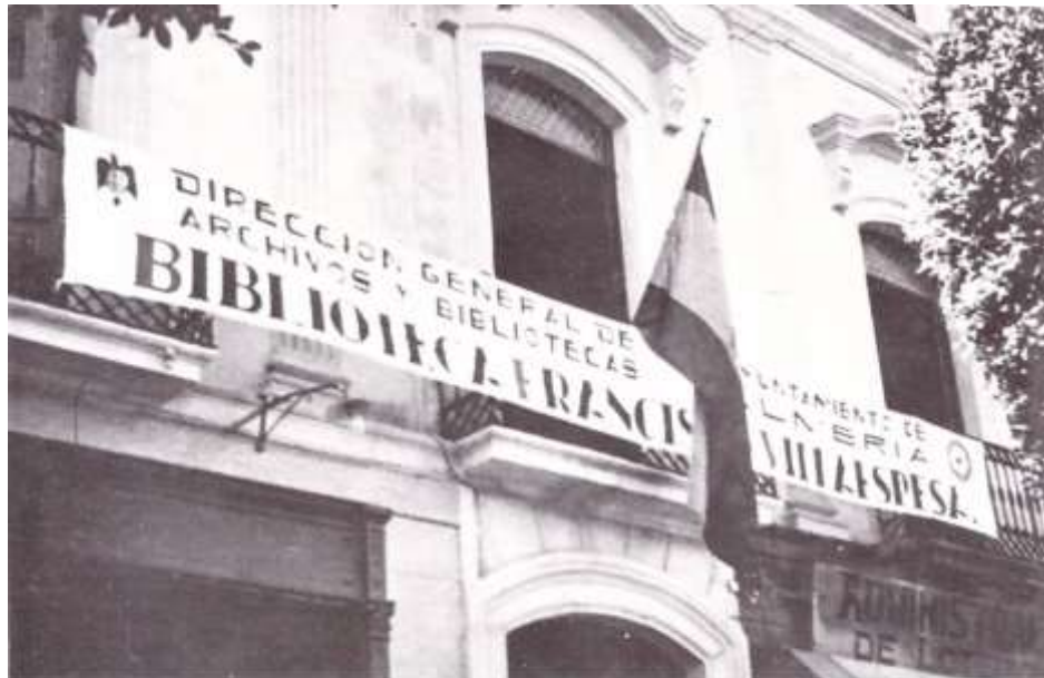
La antigua biblioteca Villaespesa. Donde Celia Viñas organizó actividades literarias, pictóricas, musicales de primer nivel y donde impartió varias conferencias. Se inauguró en 1947.