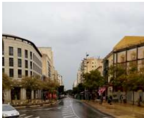
Actual paseo de Almería.