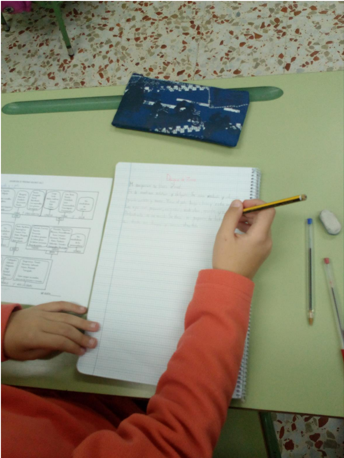
Haciendo la descripción de una alumna de la clase con la ayuda del esquema de la descripción de personas