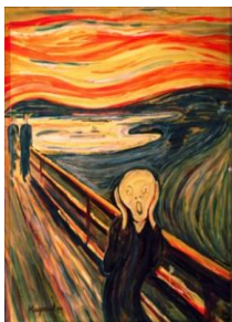
EL MIEDO- Munch