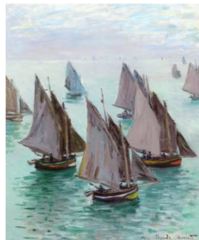
MAR EN CALMA -Monet