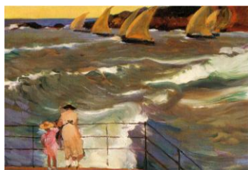
SALIDA DE BARCAS- Sorolla