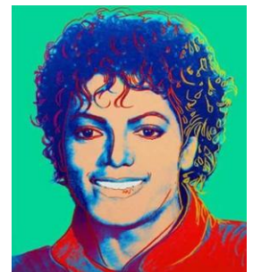
MICHAEL JACKSON - Andy Warhol