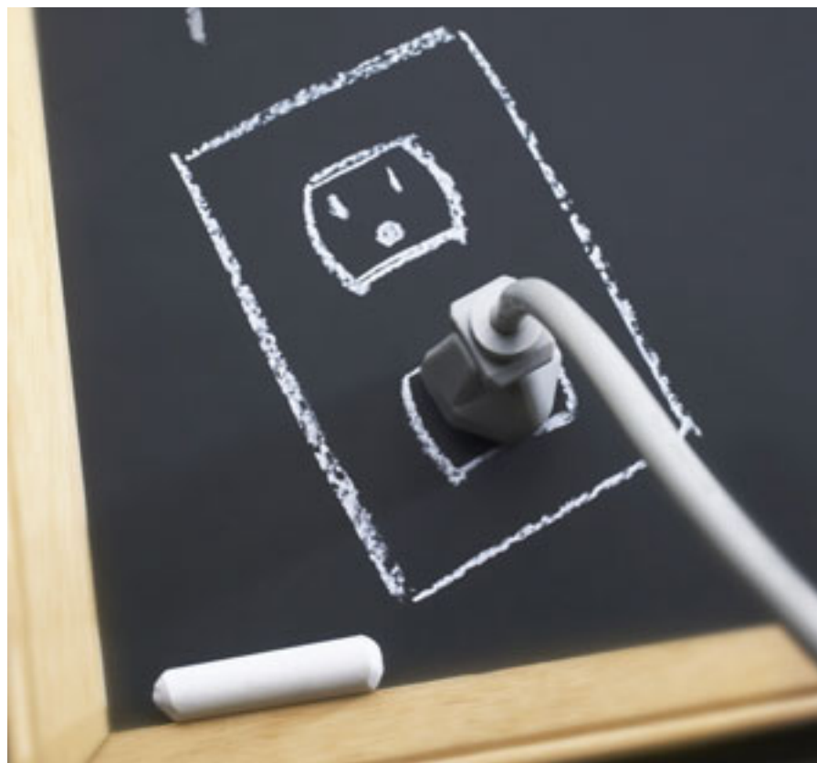
Por el uso de ordenadores, de proyectores de diapositivas... Los contactos eléctricos son otros de los riesgos que deben evitar los docentes.