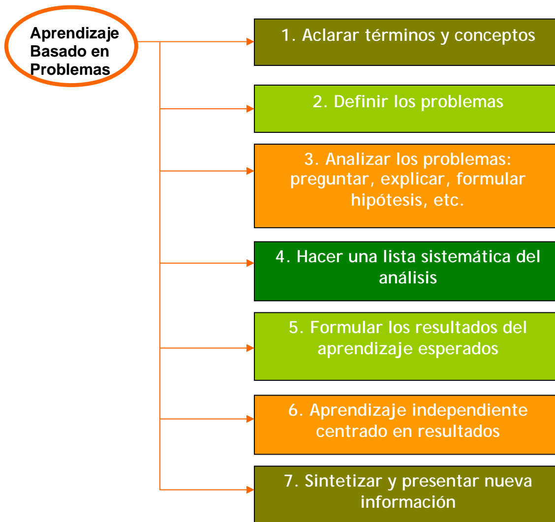
Figura II. Fases del Proceso de ABP (Exley y Dennick, 2007)

Otros autores, como Exley y Dennick (2007) realizan otra clasificación de las fases del ABP. Ellos señalan que son siete fases las que lo conforman.