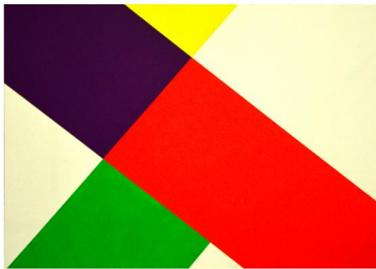
Energía roja y violeta a 40°. 2014