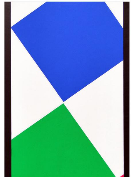
Módulo 4x3 2.4.8 55°. 2012