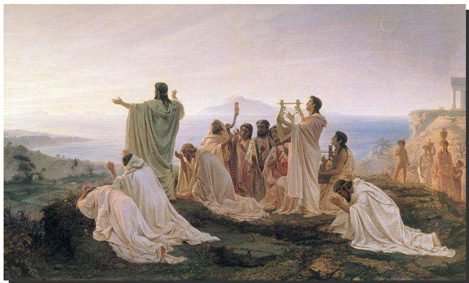
Pitagóricos celebrando el amanecer. Óleo de Fyodor Bronnikov.

Teano fue una buena alumna y llegó a ser maestra. Cuando fallece Pitágoras ella sigue con su trabajo en la escuela y junto a sus hijos extiende por toda Grecia la labor que Pitágoras había iniciado.