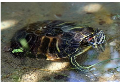
La tortue d'eau douce