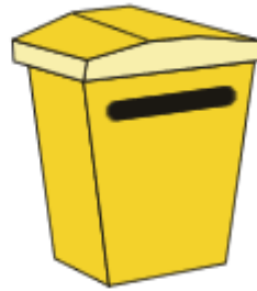
PLÁSTICOS Y ENVASES