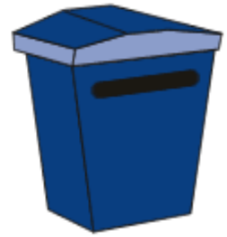
PAPEL Y CARTÓN