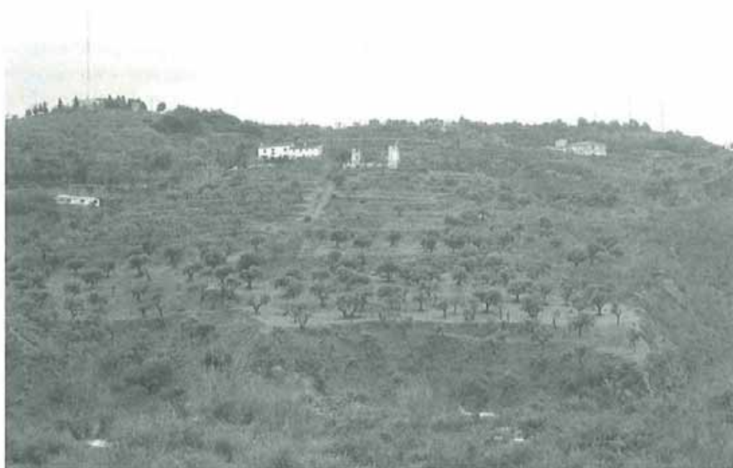
Foto II. Terrazas de cultivo del área periurbana de Granada regadas por la acequia de Aynadamar

de la ciudad, induce a pensar que era vendida a quienes tenían necesidad de ella, con objeto de dedicar lo obtenido a la reparación de las murallas urbanas. Se trataba, pues, de una especie de habiz o fundación con finalidad, en este caso, pública, aunque en otros podía ser de tipo piadoso (salario del alfaquí, cuidado de la mezquita o rábita, etc.) e incluso familiar (habices ahli). En otras acequias, como ocurre, por ejemplo, en Omán, la venta de turnos a los regantes, en un determinado momento del día o de la semana, tenía como función el mantenimiento de la propia estructura hidráulica. No sabemos si eso ocurría en Aynadamar, aunque sí que los daños en este canal implicaban a las comunidades beneficiarias, es decir, a los vecinos de los dos barrios granadinos de la colina albayzina y a Víznar, teniendo cada una responsabilidades diferentes.