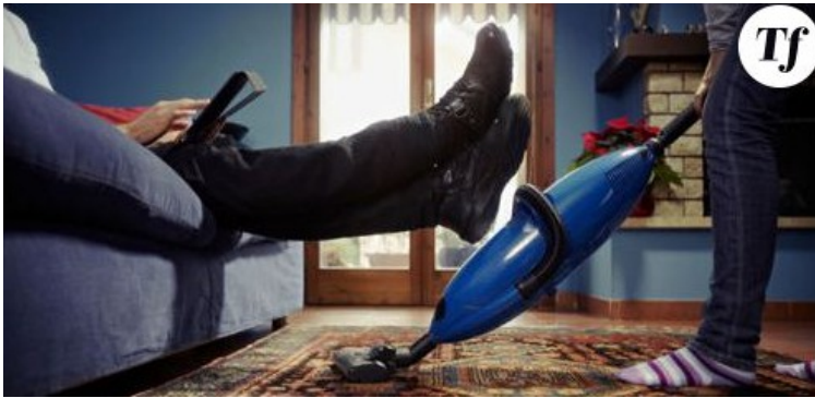
Image 3: c