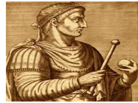
Constantino de Constantinopla

El hecho, posiblemente más importante del siglo IV fue la conversión al cristianismo del emperador romano Constantino.