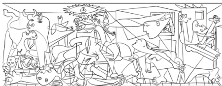
Picasso – El Guernica