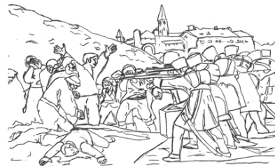
Goya – Fusilamientos del 3 de Mayo