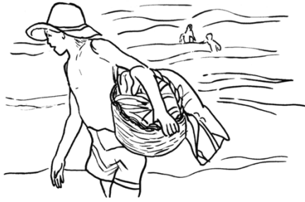
Sorolla – El pescador