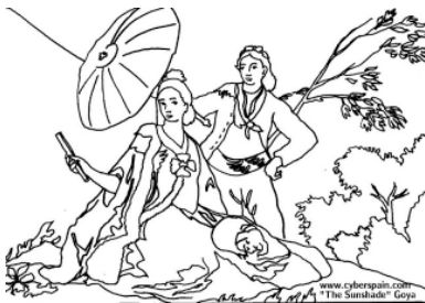
Goya - El paraguas