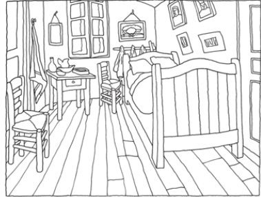
Vicent Van Gogh - La habitación