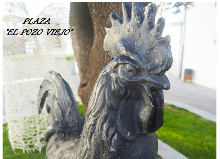
Domingo Blanco Muñoz “El Pozo Viejo” REALIZADA POR DOMINGO BLANCO