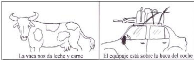
vaca , animal doméstico

Palabras homófonas son aquellas que suenan igual pero se escriben de distinta forma y tienen significado distinto.