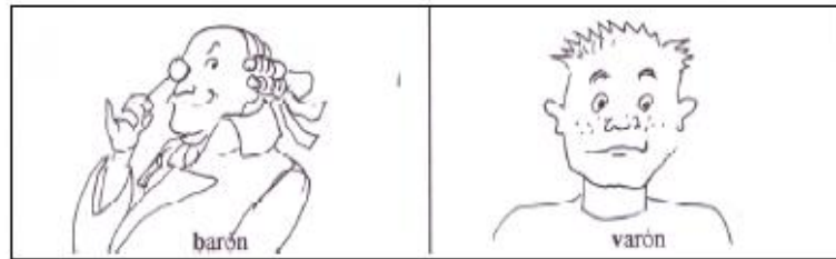
barón , título nobiliario

Palabras homófonas son aquellas que suenan igual pero se escriben de distinta forma y tienen significado distinto.