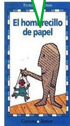
FOTO O IMAGEN DEL LIBRO

Título Autor/a Editorial Lugar y fecha de edición Ilustrador Género literario