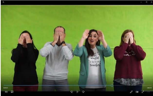
Ilustración 2: Grabación sobre fondo verde en uno de los clips del video sobre el día de la mujer

El “chroma key” o clave de color es una técnica muy utilizada en cinematografía que consiste en extraer un color de una imagen o vídeo para reemplazarla por otra imagen o vídeo, pudiendo así crear la ilusión de que se está filmando en un lugar diferente al real. Para ello, solamente se necesita colocar un fondo monocromático (usualmente verde) sobre el cual se va a desarrollar la acción, grabar la escena dentro de los límites del fondo verde, y después, mediante un programa de edición, sustituir ese color por una foto o un vídeo. A continuación, se muestra un ejemplo antes y después del uso del Chroma.