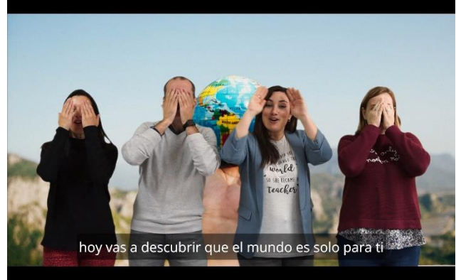
Ilustración 3: Resultado tras sustituir el fondo con una imagen en Davinci Resolve