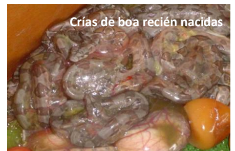
Crías de boa recién nacidas

¿Qué significa exactamente que la boa sea ovovivípara? Hay que explicarlo con menos de cuarenta palabras .