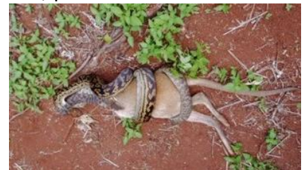
Boa tragando un canguro

Los espacios de la ciencia en esta ocasión se adentran en la zoología; y, más en concreto, en el fascinante mundo de las boas. En mis viajes y estancias por tierras americanas pude verlas en su hábitat natural selvático. La boa es un animal nocturno y solitario. Algunas, como la boa constrictor, pasan de los cuatro metros de longitud. Son de colores muy vistosos, pero lo que más me llama la atención de las boas son las largas digestiones que realizan. Como pueden devorar animales mucho mayores que ellas, gracias a su elasticidad, necesitan un largo periodo de tiempo para asimilar el atracón de comida. ¿Recordáis mis dibujos de la boa cerrada y la boa abierta?