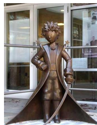
Estatua del Principito en la biblioteca de Northport

El verano de 1942 estaba siendo sofocante en aquella gran ciudad, por lo que decidimos mudarnos a orillas del mar. Pasamos una temporada en una preciosa casita de madera, en Westport. Después, alquilamos una pomposa mansión colonial en Northport. En aquellas casas de Westport y Northport escribí e ilustré mi Petit Prince, que vio la luz por vez primera en Nueva York, en la primavera del año siguiente.