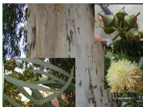
Eucalipto rojo ( Eucalyptus camaldulensis )