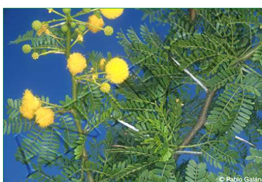
Acacia espinosa ( Acacia karoo )