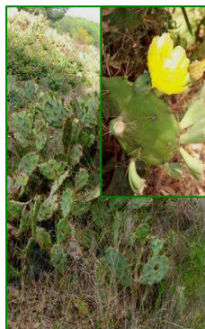
Chumbera brava ( Opuntia dillenii )