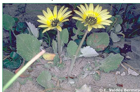
Arctoteca ( Arctotheca calendula )