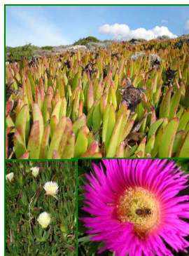
Uña de león ( Carpobrotus edulis )