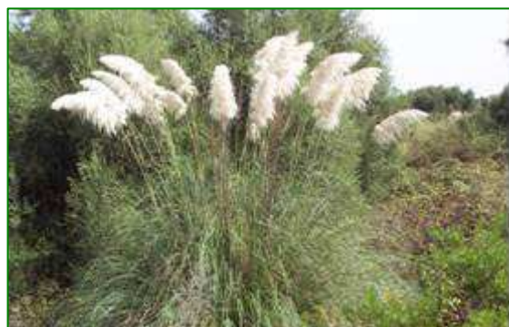
Plumero ( Cortaderia selloana )