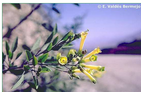
Planta del tabaco ( Nicotiana glauca )