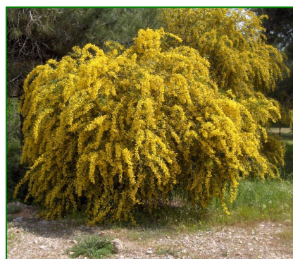
Acacia azul ( Acacia saligna )