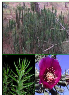
Cacto alesnado ( Opuntia subulata )