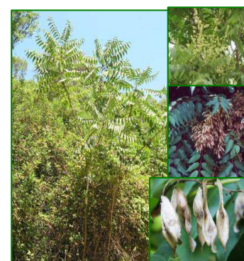
Árbol del cielo ( Ailanthus altissima )