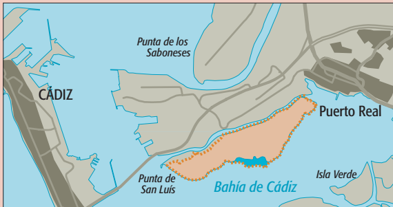
FIGURA DE PROTECCIÓN