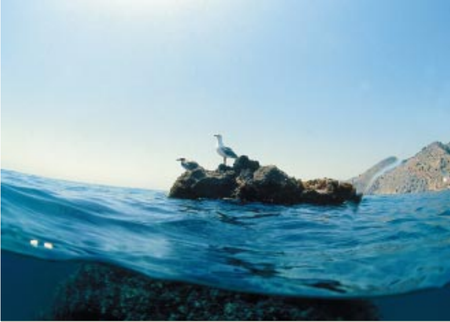
■ Tierra y mar, protegidos como un único espacio. El objetivo de las áreas de protección marítimas.