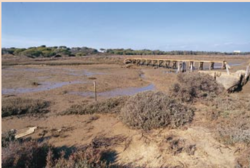
■ Las marismas del río Piedras están cubiertas de vegetación halófila, de aspecto rastrero.

Entre los animales marinos, nos encontramos peces, crustáceos y moluscos como la lubina ( Dicentrarchus labrax ), la anguila ( Anguilla anguilla ), el centollo ( Maja squinado ) y la almeja fina ( Venerupis decussata ).