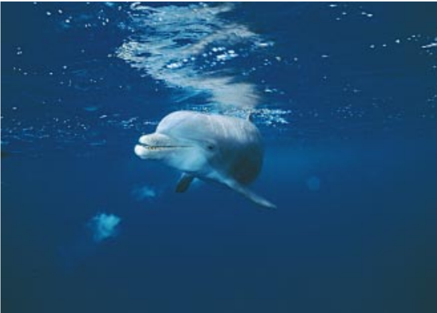
■ Un delfín mular en aguas del Estrecho, zona de paso de cetáceos.