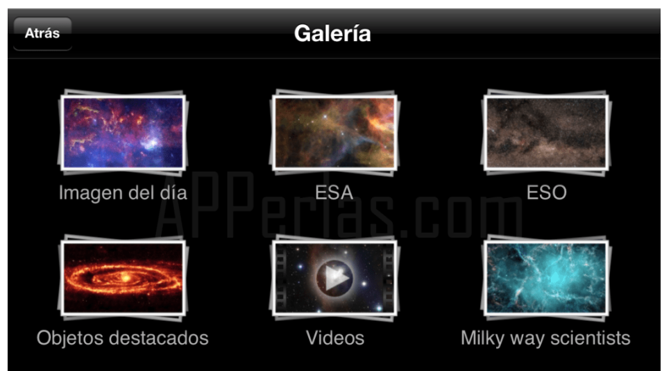
Galería de imágenes