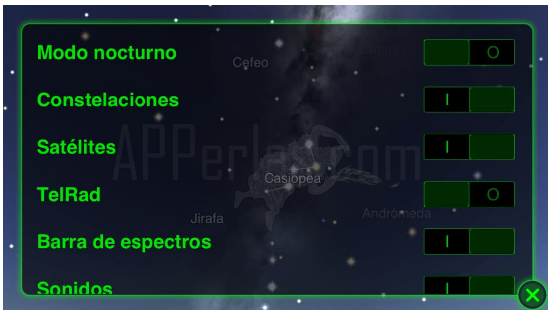
Configuración de Star Walk