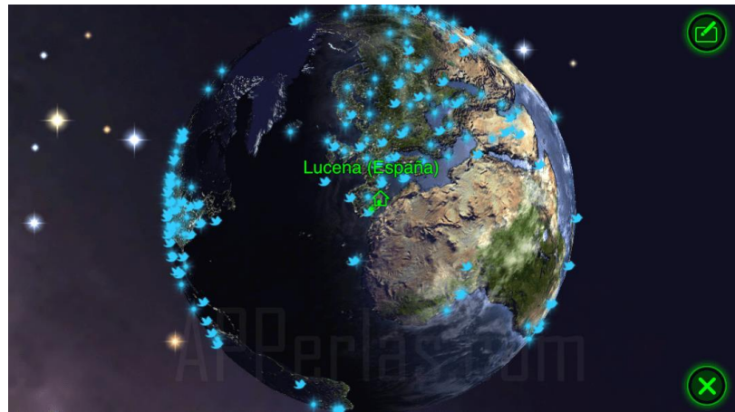
Comunidad de Star Walk