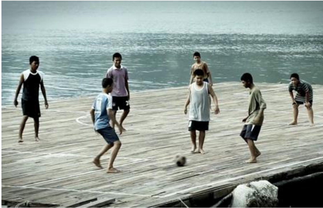
Vídeo de Panyee F.C. http://youtu.be/0UQzz7Dwuvk