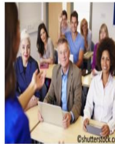
Educación de Personas Adultas