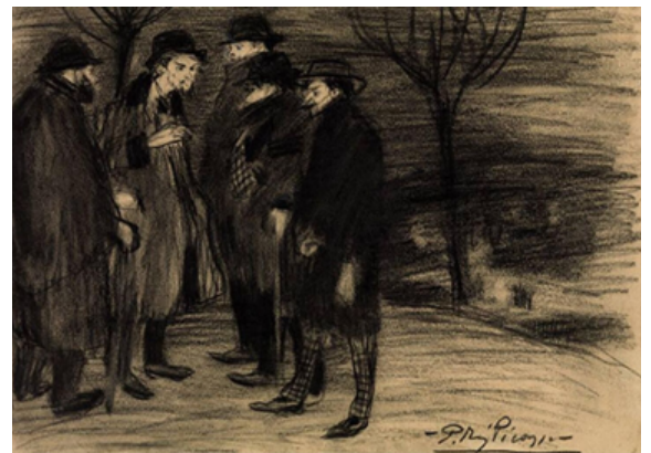
Luz del Siglo Ilustrado...