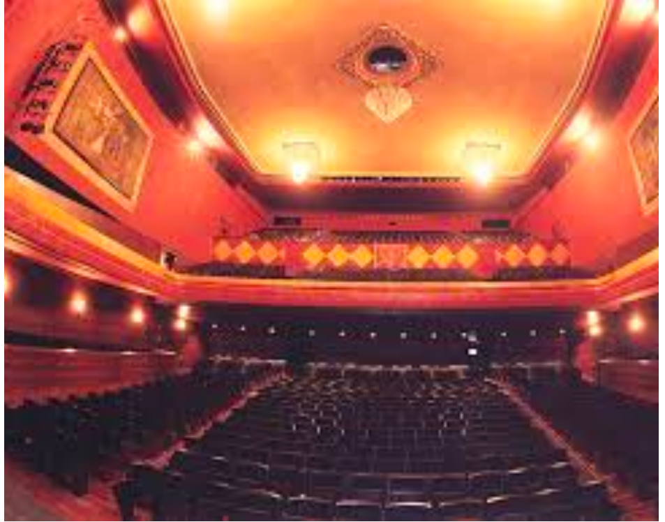
"Pie de Foto"