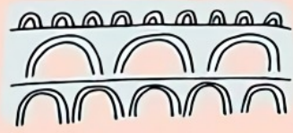
pont du gard