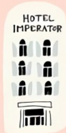
hotel imperator les belles rencontres