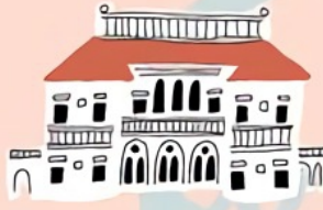
villa ephraïm de rothschild