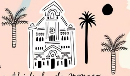
cathedrale de monaco