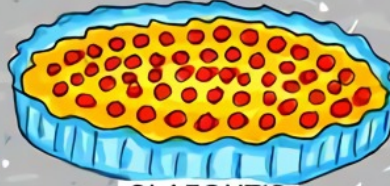
CLAFOUTIS AUX CERISES