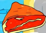
JAMBON DE BAYONNE