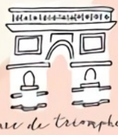
arc de triomphe