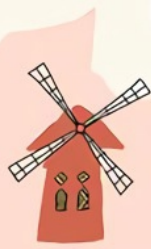
la nouvelle ère