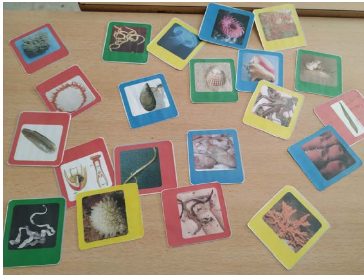
Fichas con las fotografías de los animales