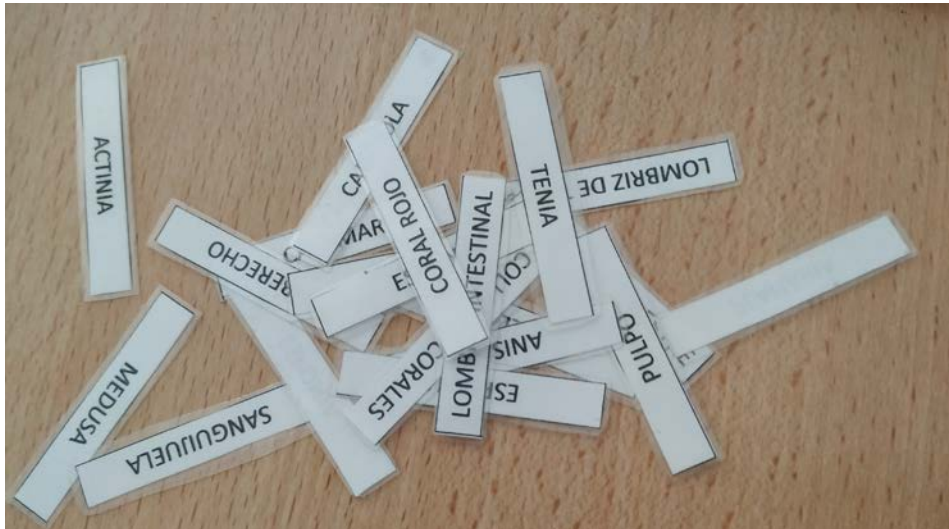
Fichas con los nombres de los animales