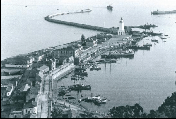
El paseo del faro, años 20

La Farola se construyó en 1816 , antes de ella ocupaba su espacio una linterna de madera , la cual tenía la misma función.