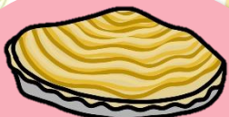
PASTEL DE CARNE