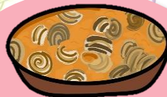
CARACOLES EN SALSA