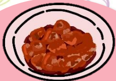
MAGRA CON TOMATE