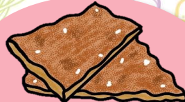
TORTA DE PIMENTÓN