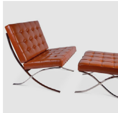
Mies van der Rohe y Lilly Reich. Silla Barcelona