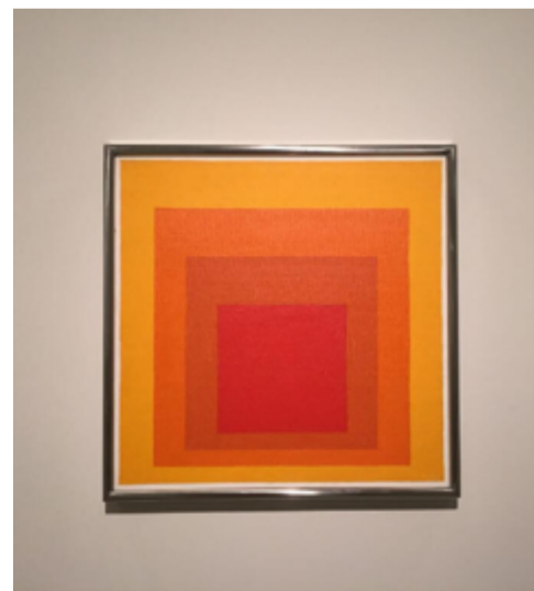
Josef Albers. Homenaje al cuadrado.