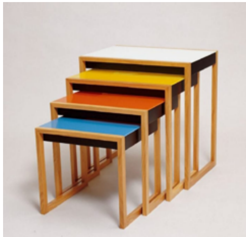
Josef Albers. Mesa nido

La verdad es que la Bauhaus le dio a la mujer una vía por donde desarrollar su talento pero también es verdad que tuvieron que lidiar con la época en la que vivía, sus familias, la actitud ambigua del cuerpo. Docente, las convenciones sociales obsoletas entre otras cosas. Aún así quien la sigue la con-