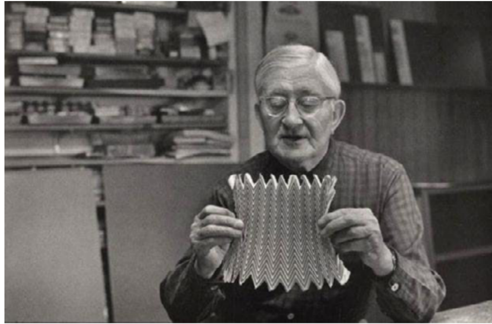
Josef Albers. El maestro de lo abstracto

Josef Albers artista gráfico y diseñador estadounidense de origen alemán fue estudiante y posteriormente profesor de dibujo de la Bauhaus, donde conoció a quien es su mujer Annie Albers. En esta entrevista nos habla de sus métodos de enseñanza, de cómo se vivieron los cambios de dirección de la Bauhaus a manos de Gropius y en su ausencia, además también nos habla de la situación de la mujer en este periodo y de la importancia de la Bauhaus en el diseño moderno.