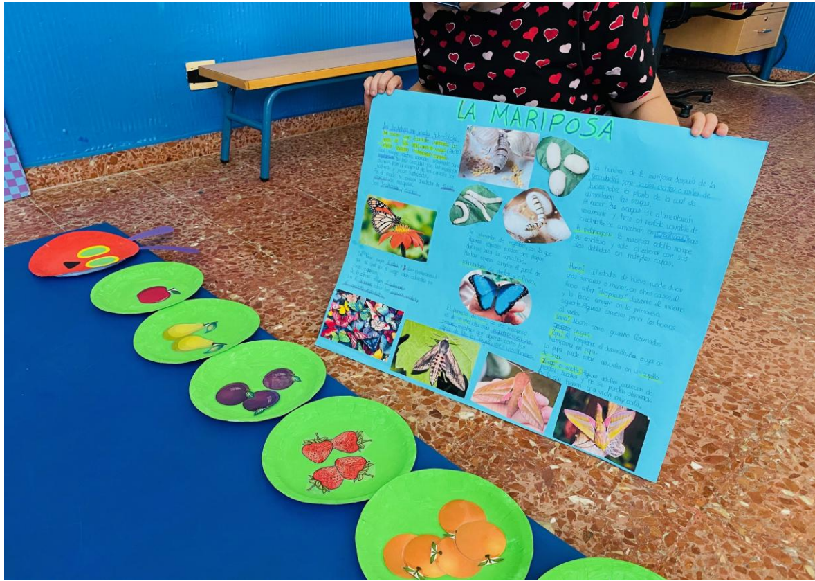
Y seguimos aprendiendo más de las mariposas.