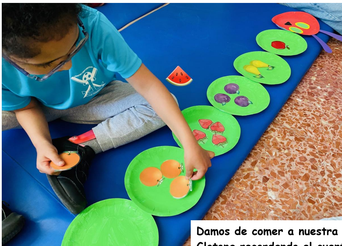
Damos de comer a nuestra Oruga Glotona recordando el cuento.