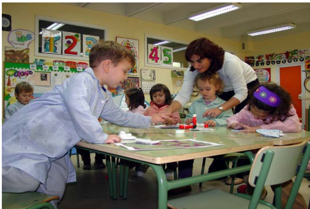
Cada estudiante tiene un estilo de aprendizaje diferente.