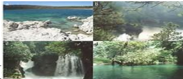
Figura 2. Aquecimento Intenso y Efecto de Miravés. a) Lago de Sanabria (Galicia, Esp.); b) Laguna (Pinar, Miravés); c) Estrecho de Pinar de Chón, San Juan Puerto; d) río Ulla (Galicia, San Juan Puerto).