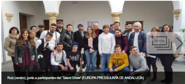
Ruiz (centro), junto a participantes del 'Talent Show'