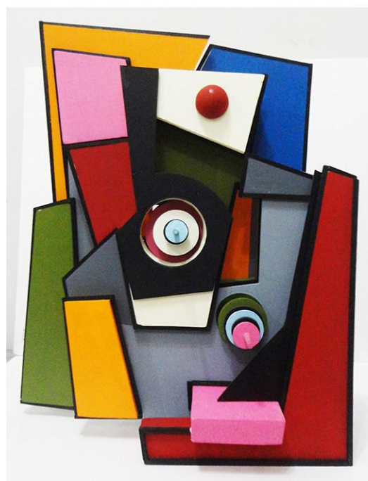
Sin título, 6