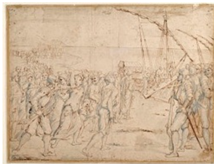
La Expulsión de los Moriscos, dibujo de Vicente Carducho

La expulsión de los musulmanes también fue impulsada por la Conquista del Reino de Granada. Esta conquista abrió el camino para que Cisneros y el resto del clero pudiesen forzar a los moros a bautizarse y a seguir la costumbres religiosas del estado. Imponiéndole estas condiciones a cambio de no ser desterrados. Finalmente, los últimos moriscos (moros bautizados) fueron expulsados a principios del siglo XVII.