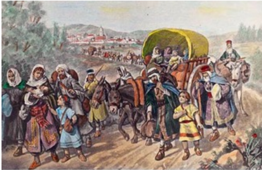
Judíos saliendo de una ciudad castellana

lado, un grupo de judíos y conversos fue acusado de matar a un niño en forma ritual, tras ser juzgados y condenados los culpables, hubo mayor odio hacia los judíos, pese a que los autores de este crimen pertenecían a un grupo minoritario de fanáticos, esto provocó ciertos motines y matanzas de ellos. El golpe final sobre ellos llegó poco después de la conquista de Granada tras un decreto de expulsión publicado el 31 de Marzo de 1492.