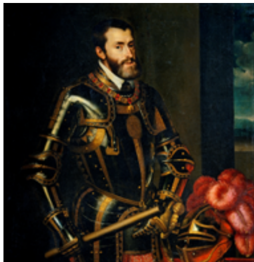
El Emperador Carlos V con el bastón, por Rubens. Copia de un retrato de Tiziano.

Hacia finales del reinado de Carlos I se fundaron las primeras comunidades e iglesias protestantes, en Valladolid y en Sevilla que estaban compuestas por miembros de la Iglesia Católica que deseaban la reforma de esta.