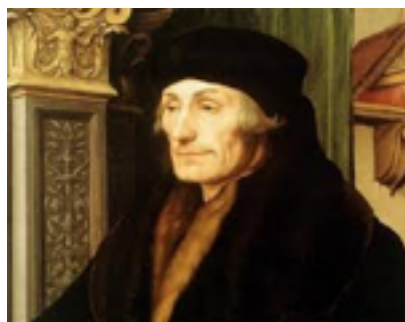
Erasmo de Rotterdam

Erasmo no es conocido como alguien que protagonizara la Reforma, pero su trabajo impulsó el comienzo de esta. Esto fue debido a que antes de su famosa edición en la que empezó a trabajar en los primeros años del Siglo XVI, no existía ninguna recopilación completa de todos los libros del Nuevo Testamento en el idioma griego. Esta obra se conoció posteriormente y también a día de hoy con el nombre de “Textus Receptus”. El cual sirvió como principal herramienta en la elaboración de las versiones que posteriormente se tradujeron al castellano.