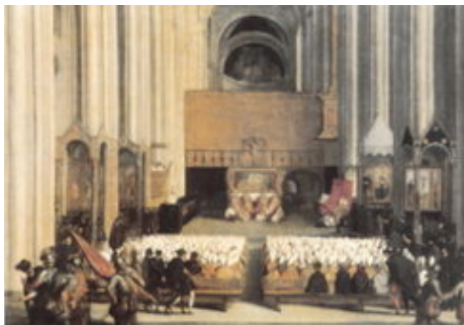
Sesión del Concilio de Trento, cuadro de Tiziano.

-Se buscaron nuevos métodos para extender la doctrina católica, por ejemplo, el catecismo y la creación de escuelas.