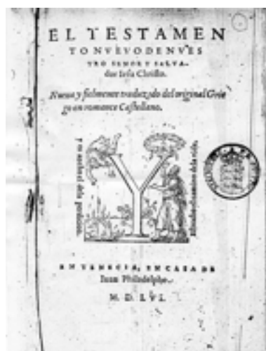
Portada del Nuevo Testamento publicado por Juan Pérez de Pineda.

En 1556, Juan Pérez publicó su versión del Nuevo Testamento y un poco después la de los Salmos.