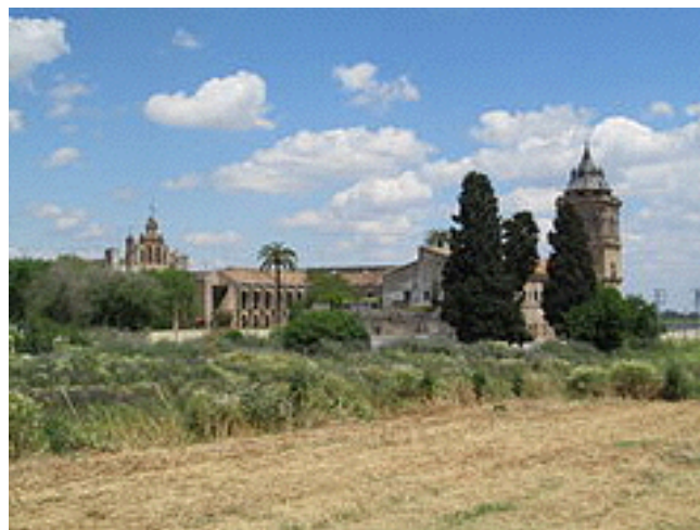
Monasterio de San Isidoro del Campo

Dentro de aquellos doce que emigraron de Sevilla se encuentran los ilustres Juan Perez, Casidoro de Reina y Cipriano de Valera quienes publicaron sus respectivas traducciones de los Textos Sagrados.