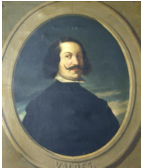
Retrato de Juan de Valdés

Cuando la Inquisición empezó a sospechar de Él decidió abandonar España y se refugió en Nápoles. Pese a que él no era Protestante, un discípulo suyo llamado Bernardino de Ochino, general de la orden de los capuchinos, se hizo protestante y tuvo que emigrar de Italia y posteriormente de Ginebra debido a que apoyó las enseñanzas de Miguel de Serveto, que formulaban declaraciones en contra de la doctrina de la Trinidad.