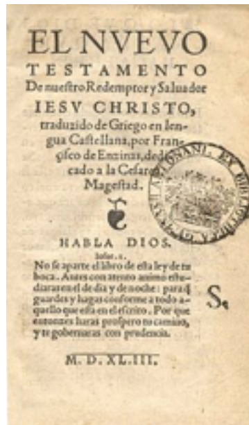
Frontispicio del Nuevo Testamento por Enzinas, publicado en Amberes 1543.

En 1543 en Amberes, Francisco de Enzinas publicó su versión del Nuevo Testamento basada sobre el texto griego de Erasmo de Rotterdam. Esta traducción fue dedicada a Carlos I. El resultado de esto fue su encarcelamiento por "fomentar la herejía".