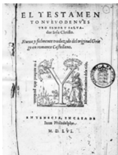
Portada del Nuevo Testamento publicado por Juan Pérez de Pineda.

En 1556, Juan Pérez publicó su versión del Nuevo Testamento y un poco después la de los Salmos.