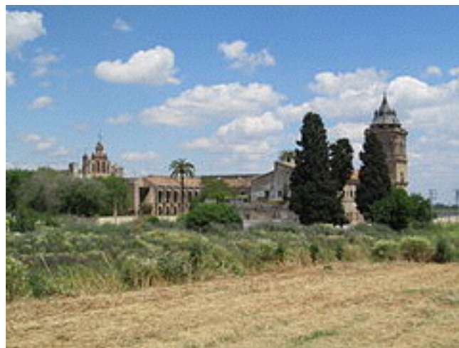
Monasterio de San Isidoro del Campo

Dentro de aquellos doce que emigraron de Sevilla se encuentran los ilustres Juan Perez, Casidoro de Reina y Cipriano de Valera quienes publicaron sus respectivas traducciones de los Textos Sagrados.