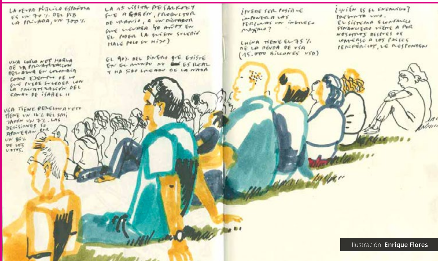
Ilustración: Enrique Flores

Las asambleas fracasan cuando pierden su aspiración por la apertura, su esfuerzo por hacer parte a aquellos que no tienen parte.