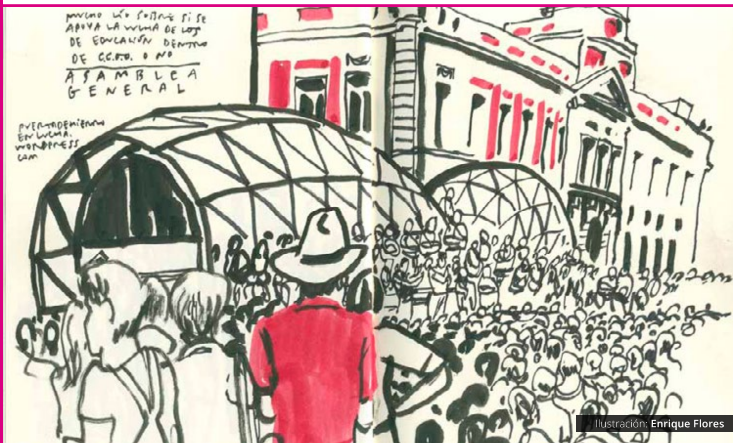
Ilustración: Enrique Flores

nibles: usando carteles, por Internet, mediante el boca a boca... La comunicación asume esa responsabilidad. Además del anuncio de la asamblea, hay otra tarea fundamental que se refiere a la divulgación de los debates mantenidos, las decisiones adoptadas y las acciones programadas en la asamblea .