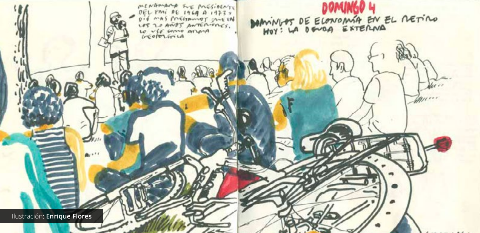
Ilustración: Enrique Flores