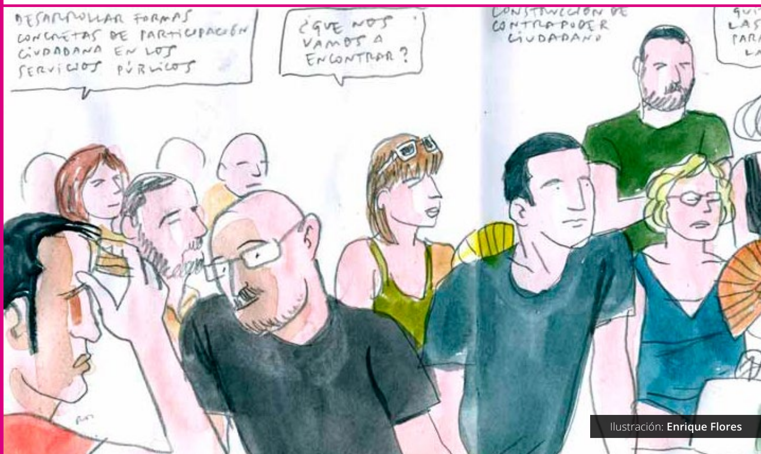
Ilustración: Enrique Flores

Una estrategia para la elaboración del orden del día cuando las asambleas son periódicas es organizar una estructura básica. Por ejemplo: comenzar explicitando el orden del día, seguir por los asuntos principales, continuar con los asuntos informativos y cerrar con otros asuntos añadidos.