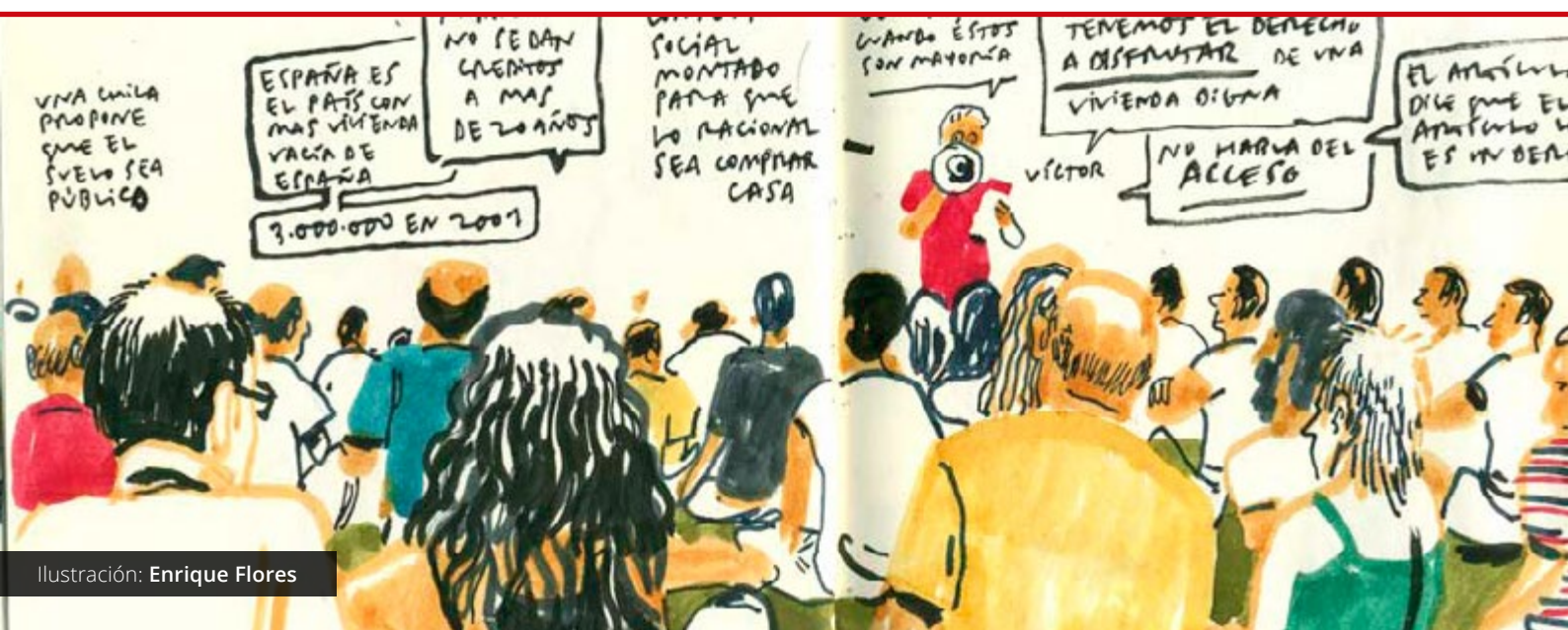
Ilustración: Enrique Flores

dirimir públicamente algún asunto común . En un caso se trata de determinar cuál es el mejor equipo, en el otro descubrir el desenlace de la trama o es el resultado de la votación de turno.