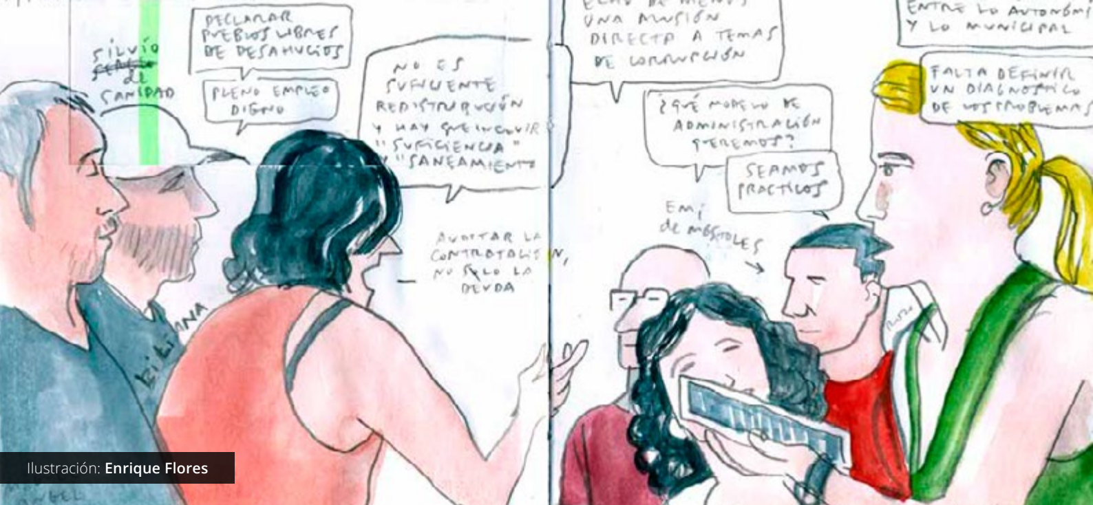
Ilustración: Enrique Flores